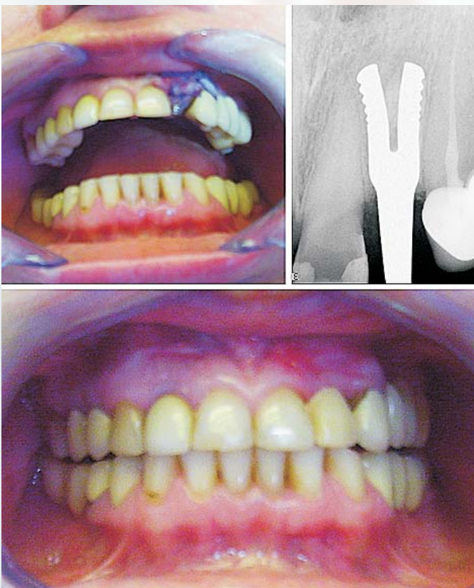
Рис. 1. Фото и рентгенограмма пациентки 24 лет: а, б - удален 2.2 зуб и одномоментно в лунку установлен имплантат с эффектом памяти формы; в - через 7 дней после операции выполнено протезирование с опорой на имплантат монокоронкой из термопластмассы.